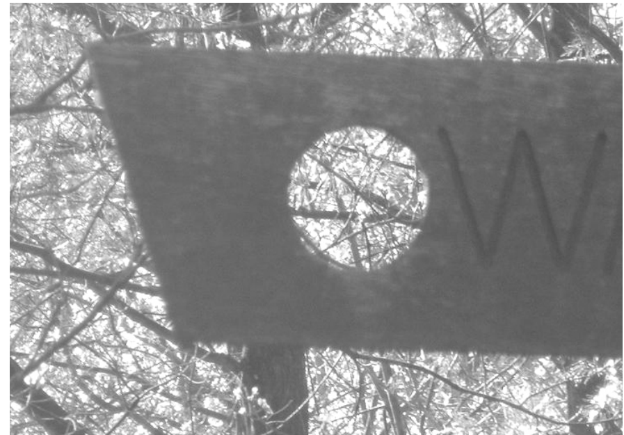
Vraag 32 : Welke steden horen bij "299" ?