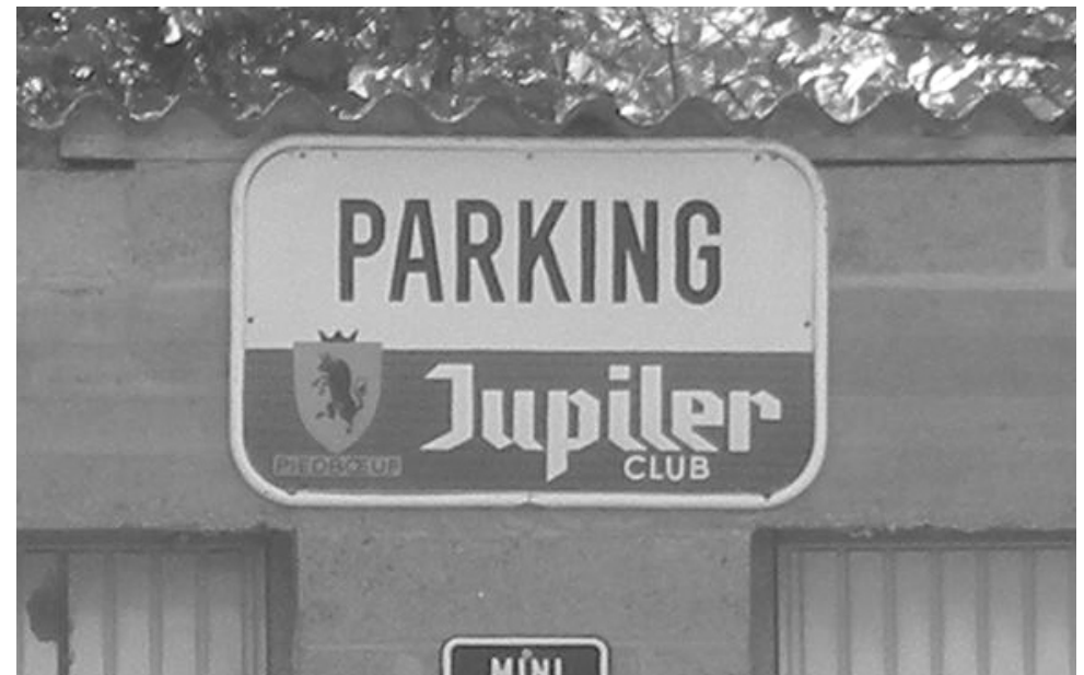
Vraag 28 : Wat betekent het verkeersbord aan de rechtse zijstraat ?