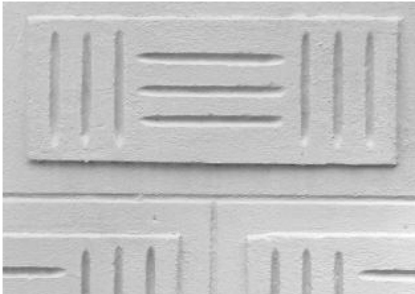
Vraag 14 : In welk jaar herbouwde men hier tegenover?