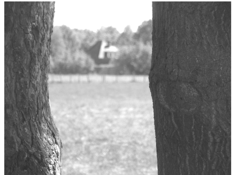
Vraag 4 : Hoeveel draden lopen tussen deze bomen door ?